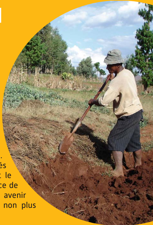
Incorporation du fumier dans le sol (Antsirabe, Madagascar).

D ans les systèmes mixtes d'agriculture et d'élevage, les biomasses produites sur l'exploitation (effluents d'élevage, résidus agricoles, végétations naturelles), autrefois délaissées ou brûlées, sont utilisées pour restaurer la fertilité des sols, suppléer l'apport de minéraux et produire des ressources alimentaires et fourragères pour les animaux. En effet, les paysans rencontrent de plus en plus de difficultés pour accéder aux intrants. Dans ce contexte, l'utilisation et le recyclage des effluents d'élevage constitue la principale source de retour de nutriments sur les parcelles agricoles. Dans un avenir proche, il faudra les considérer comme des ressources, et non plus comme des déchets.