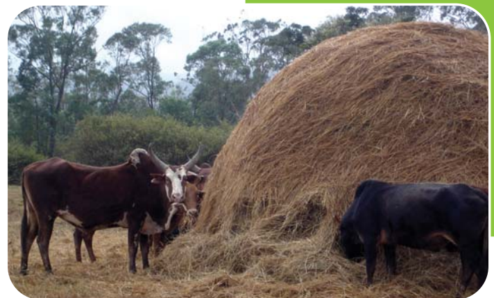
Valorisation des pailles de riz pour l'alimentation des zébus (Moramanga, Madagascar).

Finalement, l'agriculture mondiale se trouve dans une situation paradoxale aujourd'hui : si dans le contexte d'élevage intensif des zones tempérées, l'azote produit par les exploitations est considéré comme un polluant dont il faut réduire la production, il en va tout autrement dans les élevages familiaux des zones tropicales où il constitue une ressource qu'il faut absolument conserver sur l'exploitation.