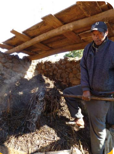
Collecte du fumier après 60 jours de stockage en tas couvert (Antsirabe, Madagascar).