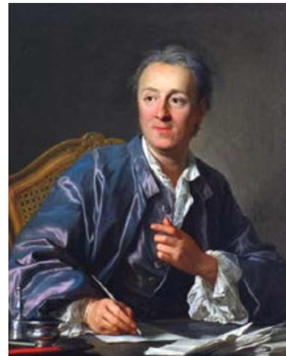
Diderot par Louis-Michel van Loo 1767 | musée du Louvre

Ce projet est co-financé par le fonds européen de développement régional.